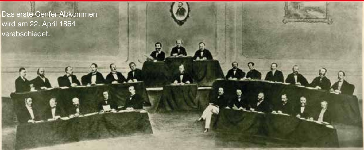
Das erste Genfer Abkommen wird am 22. April 1864 verabschiedet.

Die heute geltenden vier Genfer Abkommen von 1949 und die beiden Zusatzprotokolle von 1977 sind das Kernstück des humanitären Völkerrechts. Sie schützen Menschen vor Grausamkeit und Unmenschlichkeit in Kriegssituationen. Die Wurzeln des Roten Kreuzes auf deutschem Boden reichen zurück bis ins Jahr 1863; mit dem Vaterländischen Frauenverein Nordwalde 1866 wurde eine der ältesten Rotkreuzgliederungen in Westfalen-Lippe gegründet.