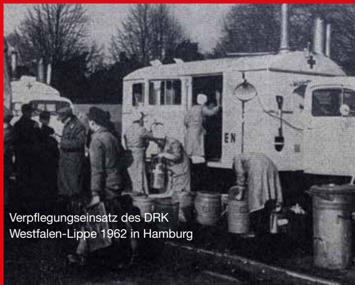
Verpflegungseinsatz des DRK Westfalen-Lippe 1962 in Hamburg