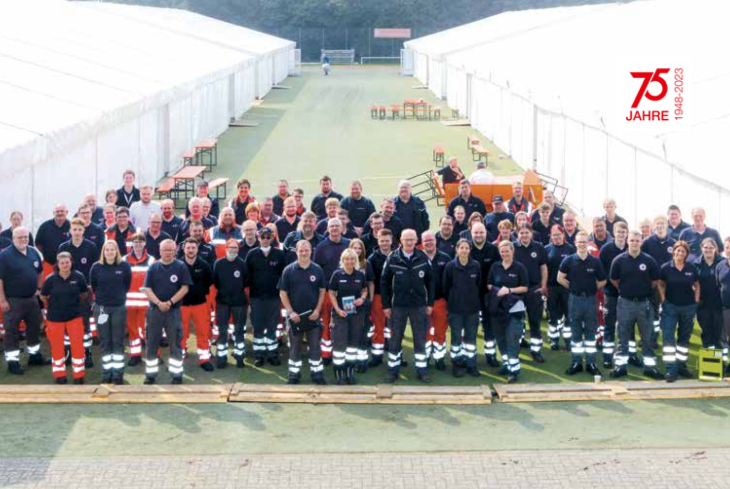
Einsatz des DRK Westfalen-Lippe nach der Hochwasserkatastrophe am 14./15.Juli 2021