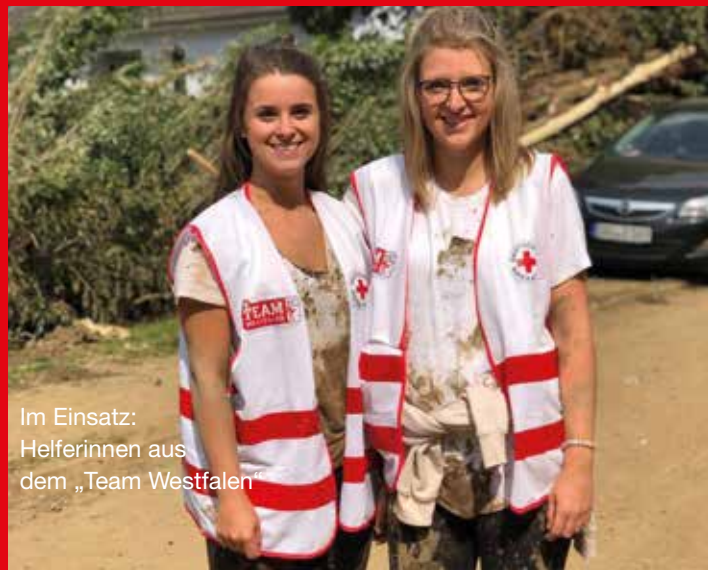
Im Einsatz: Helferinnen aus dem „Team Westfalen“

Menschen. Ob Sprachkurse, Integrationshilfen, Hilfe zur Selbsthilfe, Schwimmkurse oder Erste Hilfe mit jungen Geflüchteten: Das DRK in Westfalen-Lippe engagierte sich in den folgenden Jahren in vielen Bereichen, um den Menschen das Ankommen zu erleichtern. Damit sich Ehrenamtliche, Hauptamtliche und Geflüchtete besser auf diese neue Situation einstellen konnten, entwickelte der Landesverband eine Qualifizierungsreihe „Willkommen fördern – miteinander gestalten“. Mit dem Rollenspiel „Youth on the Run“ versetzte das Jugendrotkreuz Westfalen-Lippe Teilnehmende 24 Stunden lang in die Situation somalischer Flüchtlinge. Das intensive Rollenspiel ermöglichte es jungen Menschen innerhalb einer kurzer Zeit, die oft schwierige Lage von Flüchtlingen besser nachzuempfinden.