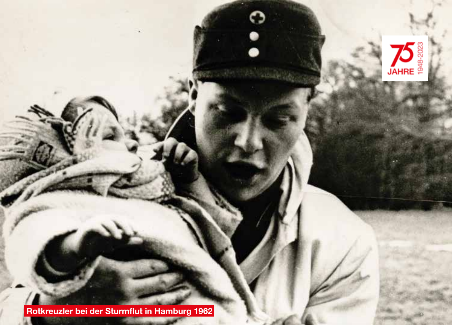
Rotkreuzler bei der Sturmflut in Hamburg 1962