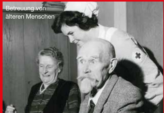
Betreuung von älteren Menschen

len für erwachsene Zugewanderte und 20 Integrationsagenturen, von denen fünf Servicestellen für Antidiskriminierungsarbeit sind. Für frischen Wind sorgte auch das Freiwillige Soziale Jahr (FSJ). Im August 1968 begann in Münster die erste FSJ-Gruppe des DRK-Landesverbandes Westfalen-Lippe ihre Tätigkeit. Junge Menschen würden für die Zeit von 12 Monaten anderen Menschen helfen – Kindern, Kranken und alten Menschen – und dabei für sich persönlich Lebenserfahrung sammeln, so das Mitteilungsblatt „Idee und Tat“. Personelle Engpässe in der Pflege gab es bereits in früheren Jahren: „Vom Notstand in der häuslichen Pflege“ berichtete zum Beispiel ein Beitrag in der „Idee und Tat“ vom November 1991 und forderte: „Ambulante gesundheits- und sozialpflegerische Dienste müssen erheblich ausgebaut werden.“