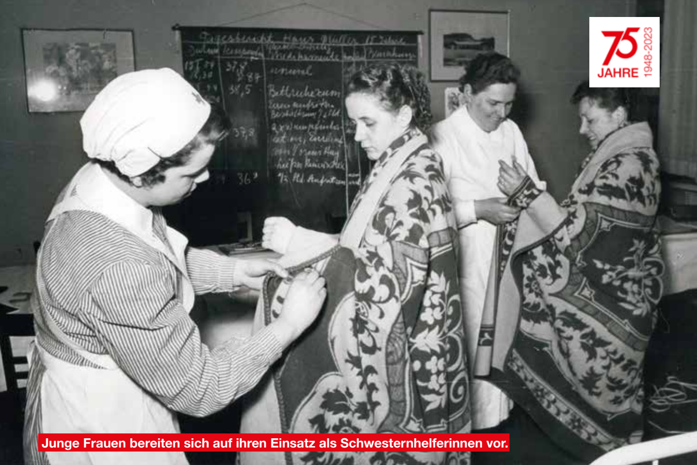
Junge Frauen bereiten sich auf ihren Einsatz als Schwesternhelferinnen vor.