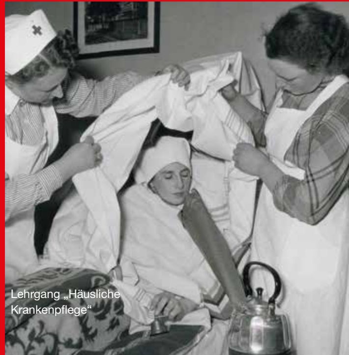
Lehrgang „Häusliche Krankenpflege“

„DRK-Landesverband Westfalen“ in „DRK-Landesverband Westfalen-Lippe“ beschlossen. Einen Tag später fand der „Landesverbandstag“ statt: „Der Landesverbandstag am 31. Mai 1953 war ein machtvolles Bekenntnis aller DRK-Mitglieder in Westfalen zu der Idee des Roten Kreuzes und gab der Öffentlichkeit Zeugnis von der Stärke unserer Organisation und ihrer segensreichen Tätigkeit.“ Trotz des regnerischen Wetters seien 6.000 Mitglieder erschienen. Im Rahmen der Veranstaltung fand auch der „Landeswettbewerb in Erster Hilfe“ statt; die Siegergruppe stammte aus dem Kreisverband Bielefeld-Stadt.