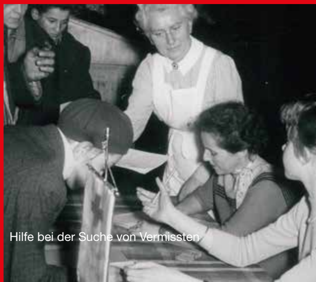
Hilfe bei der Suche von Vermissten

Im Rahmen der Wohlfahrtsarbeit wurden 1951 mehr als 57.000 Menschen, darunter über 30.000 Geflüchtete, durch „wirtschaftliche Fürsorge“ unterstützt. Im ersten Blutspendejahr 1952 gab es in NRW bereits 114 Blutspendetermine mit 7.773 Blutspendern.