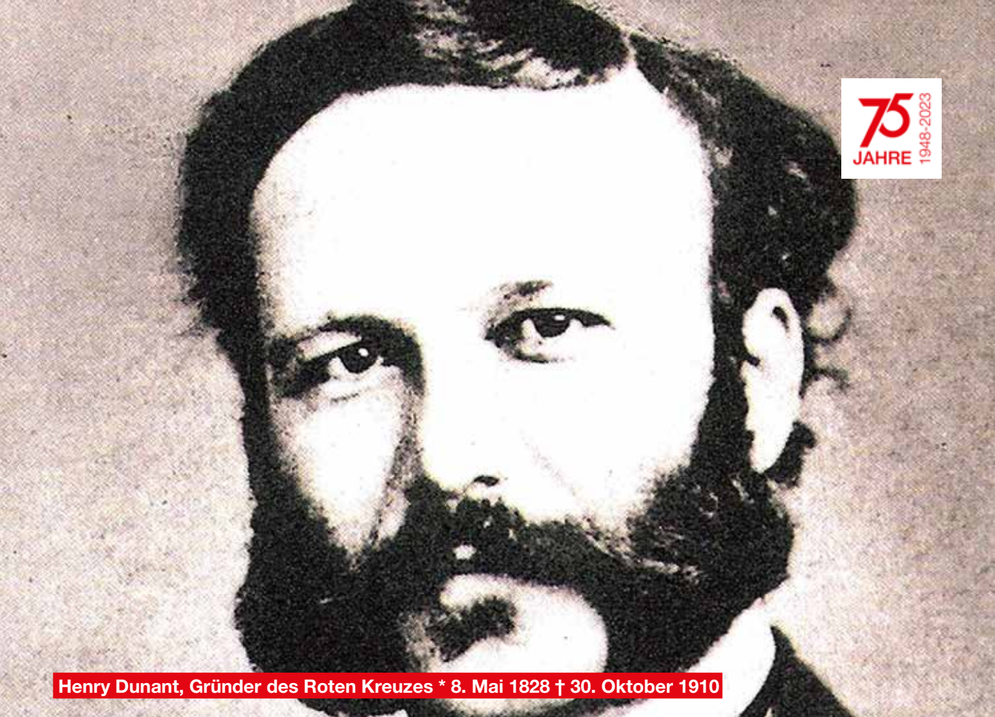
Henry Dunant, Gründer des Roten Kreuzes * 8. Mai 1828 † 30. Oktober 1910