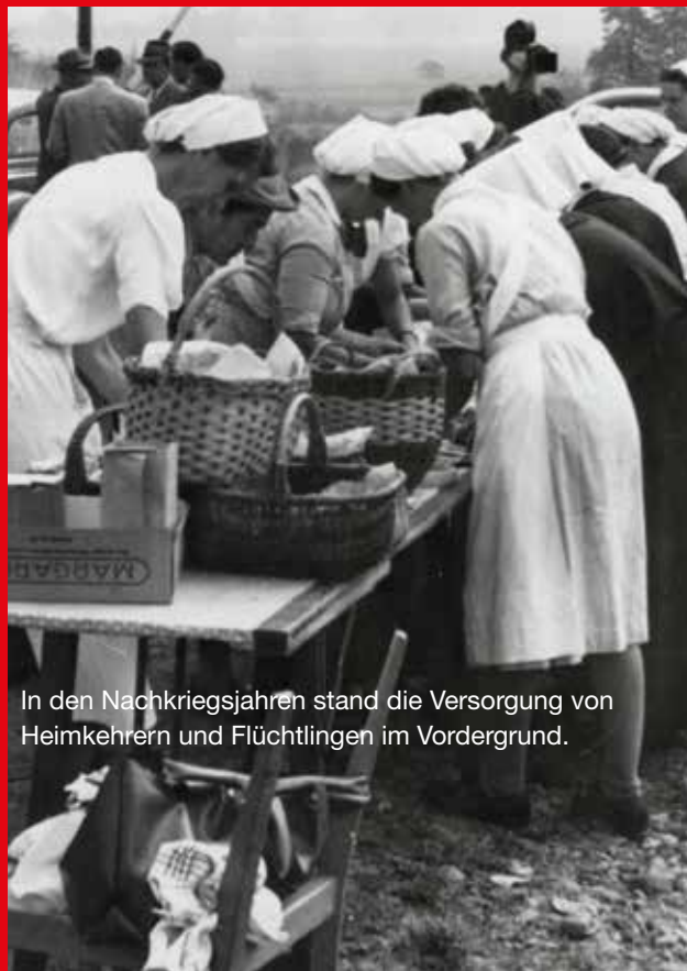
In den Nachkriegsjahren stand die Versorgung von Heimkehrern und Flüchtlingen im Vordergrund.

lung von Care-Paketen sowie die Durchführung von Schul- und Kleinkinder-Speisungen. Der Geschäftsbericht von 1947 erwähnt die Trägerschaft von zwei Krankenhäusern, fünf Altenheimen, vier Kinderheimen, einem Heimkehrer-Erholungsheim und den Betrieb von 14 Volks- und Gemeinschaftsküchen. Zu den Zielen gehörte die Schaffung weiterer Kindergärten und Gemeindepflegestationen im Verbandsbereich.