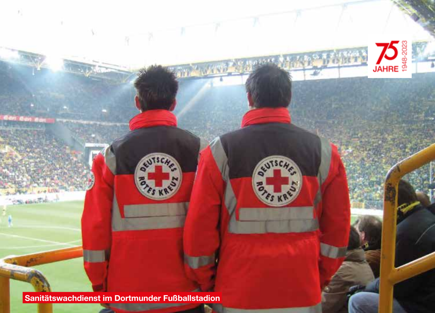
Sanitätswachdienst im Dortmunder Fußballstadion