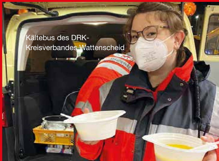
Kältebus des DRK- Kreisverbandes Wattenscheid