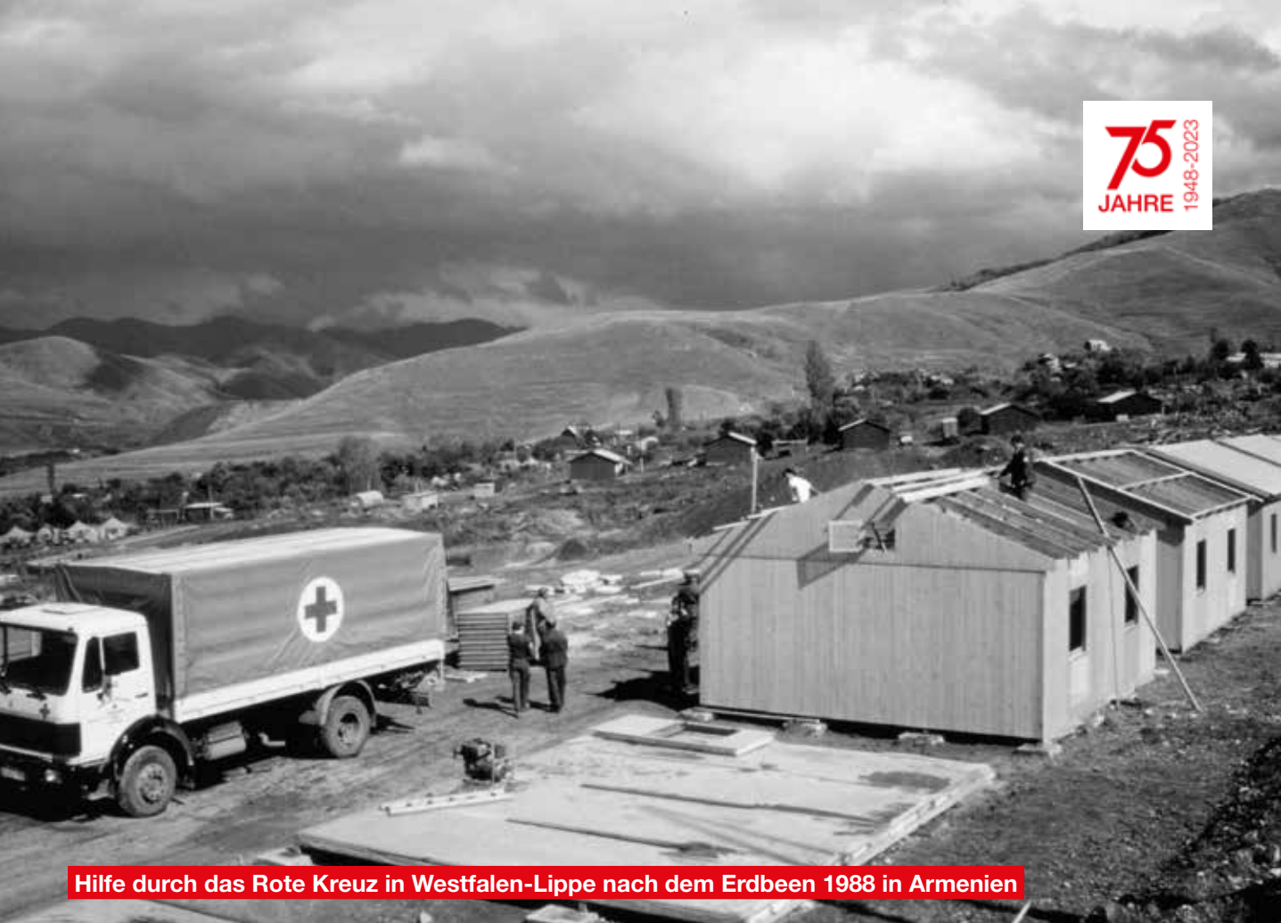
Hilfe durch das Rote Kreuz in Westfalen-Lippe nach dem Erdbeben 1988 in Armenien