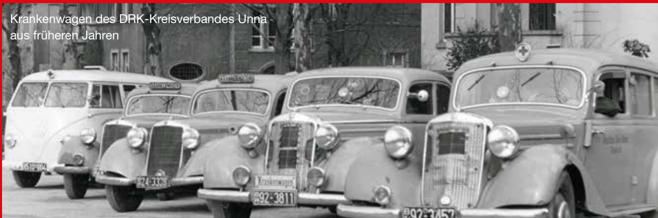
Krankenvagen des DRK-Kreisverbandes Unna aus früheren Jahren

Heute ist das Rote Kreuz in Westfalen-Lippe an mehr als 20 Standorten in den öffentlichen Rettungsdienst eingebunden; in einigen Kreisen wird der Rettungsdienst fast vollständig durch das DRK durchgeführt.