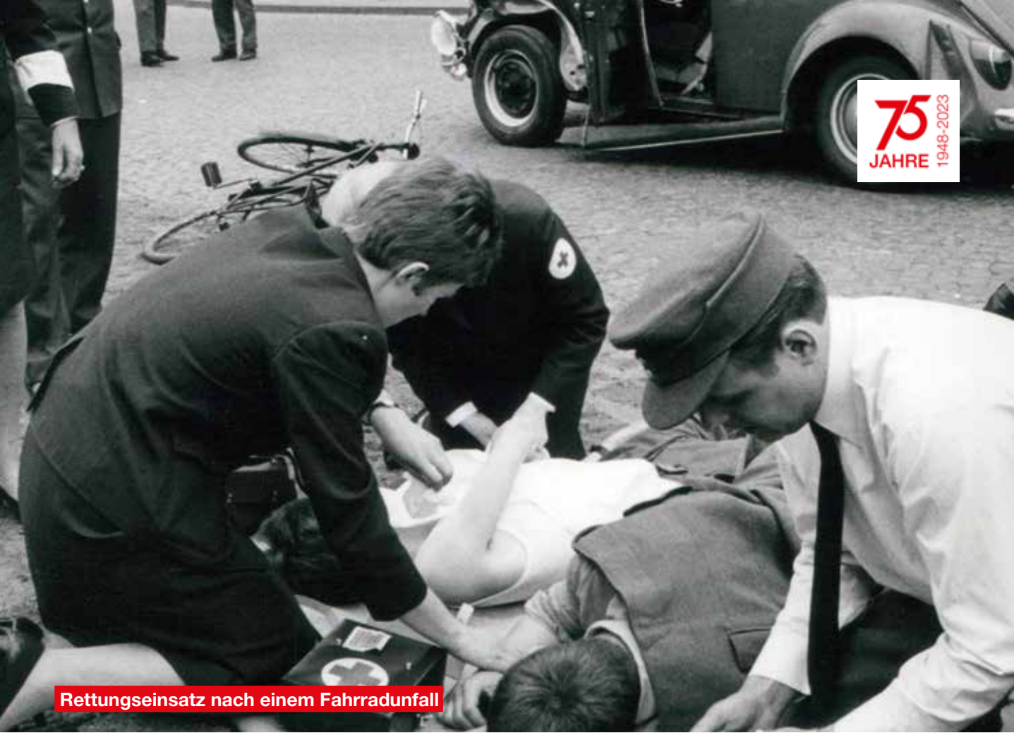
Rettungseinsatz nach einem Fahrradunfall