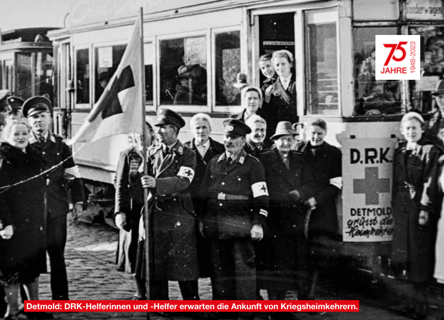
Detmold: DRK-Helferinnen und -Helfer erwarten die Ankunft von Kriegsheimkehrern.