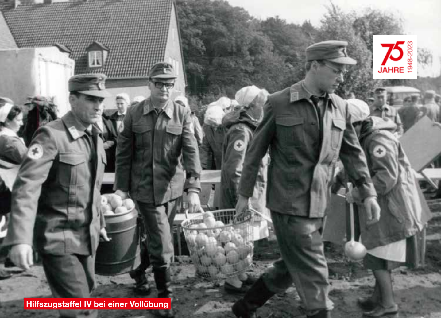
Hilfszugstaffel IV bei einer Vollübung