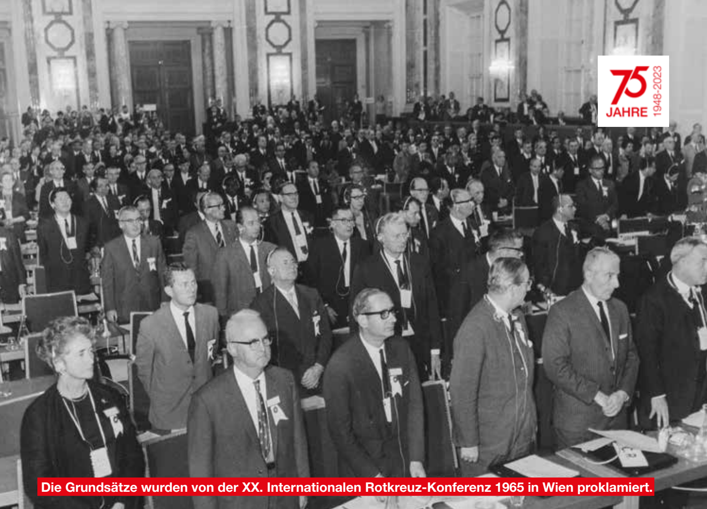
Die Grundsätze wurden von der XX. Internationalen Rotkreuz-Konferenz 1965 in Wien proklamiert.