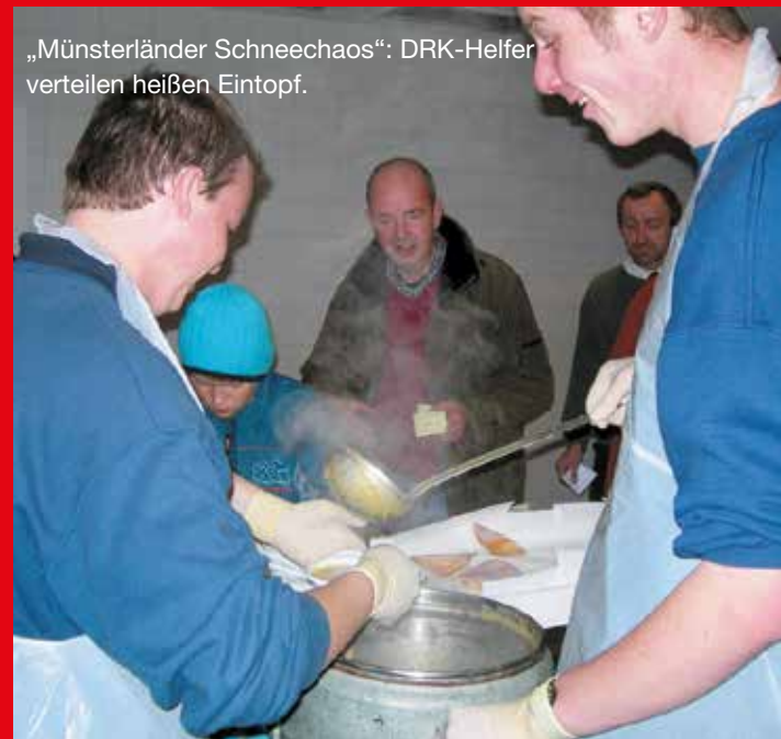
„Münsterländer Schneechaos“: DRK-Helfer verteilen heißen Eintopf.