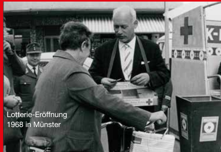
Lotterie-Eröffnung 1968 in Münster

In den 1970er Jahren gibt es aber nicht nur Erfolgszahlen zu vermelden: Im November 1973 gibt der DRK-Suchdienst bekannt, dass die Schicksale von einer Million Wehrmachtssoldaten geklärt werden konnten. In 93 Prozent der Fälle musste der Tod festgestellt werden, nur 7 Prozent hatten überlebt. Damals heißt es in unserem Mitteilungsblatt: „Keine stolze Erfolgsbilanz [...], die jedoch für viele tiefgreifende Bedeutung hat.“