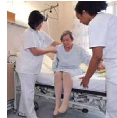
Daraus ergibt sich für unser pflegerisches Handeln

Niemand kann durch Einzelne oder durch Staatsgewalt zur Mitgliedschaft in einer Gliederung der Nationalen Rotkreuzgesellschaft gezwungen werden.