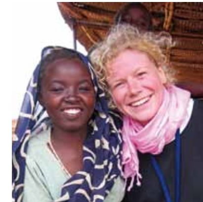
Daraus ergibt sich für unser pflegerisches Handeln

Gegen Inhumanität ist nicht Neutralität, sondern Stellungnahme erforderlich.