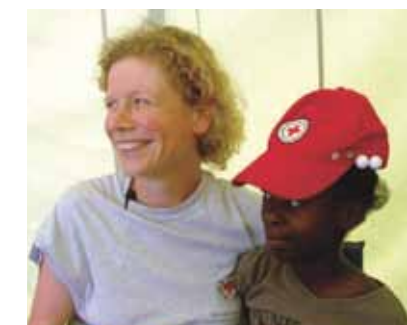
Daraus ergibt sich für unser Verständnis von Schwesternschaft