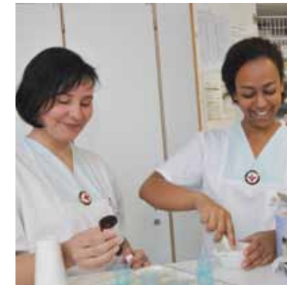
Für den Begriff Einheit formulieren wir 1

In jedem Land kann es nur eine einzige nationale Rotkreuz- oder Rothalbmondbewegung geben. Sie muss allen offen stehen und ihre humanitäre Tätigkeit im ganzen Gebiet ausüben.