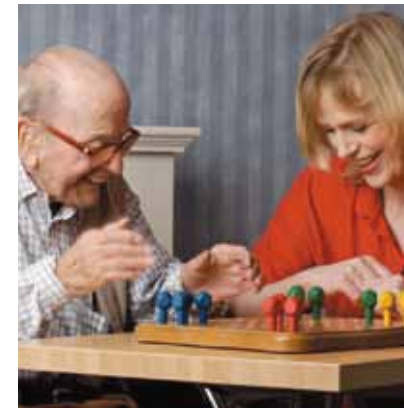
Für den Begriff Menschlichkeit formulieren wir 1

Die internationale Rotkreuz- und Rothalbmondbewegung, entstanden aus dem Willen, den Verwundeten der Schlachtfelder unterschiedslos Hilfe zu leisten, bemüht sich in ihrer internationalen und nationalen Tätigkeit, menschliches Leid überall und jederzeit zu verhüten und zu lindern. Sie ist bestrebt, Leben und Gesundheit zu schützen und der Würde des Menschen Achtung zu verschaffen. Sie fördert gegenseitiges Verständnis, Freundschaft, Zusammenarbeit und einen dauerhaften Frieden unter allen Völkern.