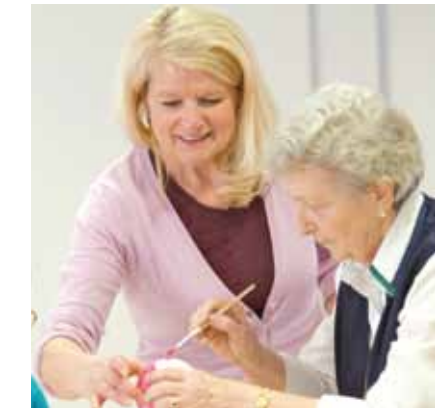
Daraus ergibt sich für unser Verständnis von Schwesternschaft

• dass wir ehrenamtlich Tätige und Angehörige in die professionelle Pflege integrieren und sie sachgerecht anleiten, um die bestmögliche Versorgung der Menschen zu erreichen.