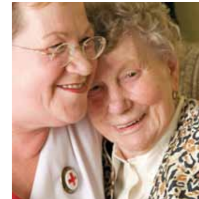
Daraus ergibt sich für unser pflegerisches Handeln 2

Menschlichkeit ist das Grundprinzip aller humanitären Hilfe im In- und Ausland.