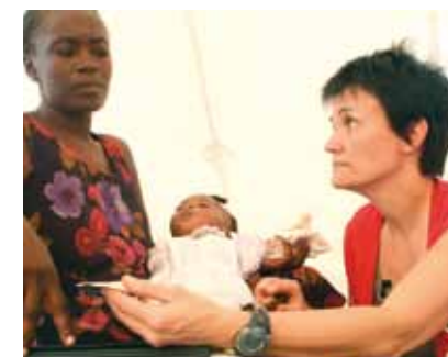
Daraus ergibt sich für unser pflegerisches Handeln