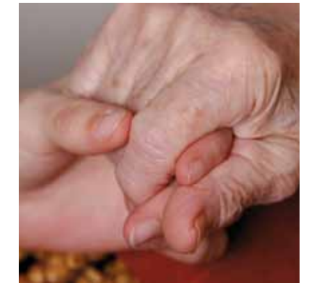
Daraus ergibt sich für unser Verständnis von Schwesternschaft 3