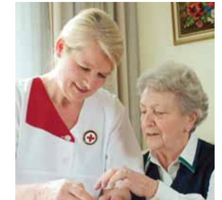
Daraus ergibt sich für unser Verständnis von Schwesternschaft

• dass wir im Auftrag und unter dem Schutz des IKRK und der Föderation der Rotkreuz- und Rothalbmondbewegung weltweit humanitäre Hilfe leisten.