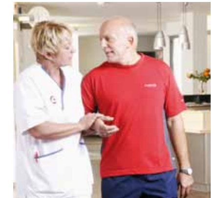
Daraus ergibt sich für unser Verständnis von Schwesternschaft

• dass wir, um unsere Unabhängigkeit zu erhalten, keine Geschenke zur persönlichen Bereicherung annehmen 3 .