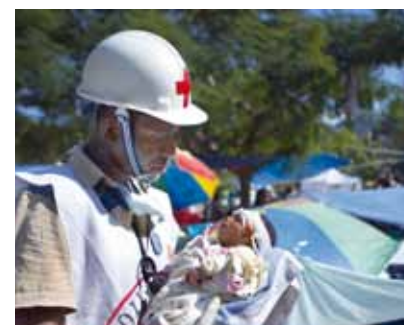
Für den Begriff Unparteilichkeit formulieren wir 1

Die Rotkreuz- und Rothalbmondbewegung unterscheidet nicht nach Nationalität, Rasse, Religion, sozialer Stellung oder politischer Überzeugung. Sie ist einzig bemüht, den Menschen nach dem Maß ihrer Not zu helfen und dabei den dringendsten Fällen Vorrang zu geben.