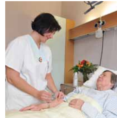
Für den Begriff Universalität formulieren wir 1

Die Rotkreuz- und Rothalbmondbewegung ist weltumfassend. In ihr haben alle Nationalen Gesellschaften gleiche Rechte und die Pflicht, einander zu helfen.