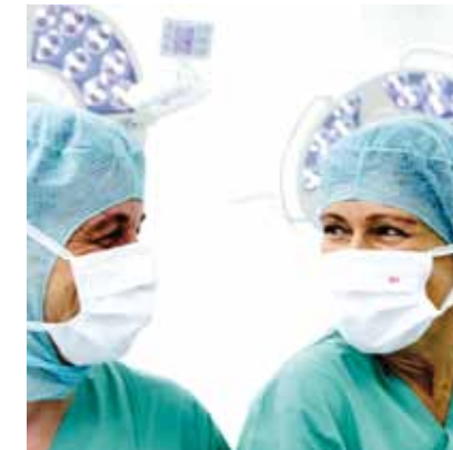
Daraus ergibt sich für unser pflegerisches Handeln

Das Rote Kreuz vereint Menschen in ihrer ganzen Verschiedenheit: im Extremfall Freunde und Feinde.