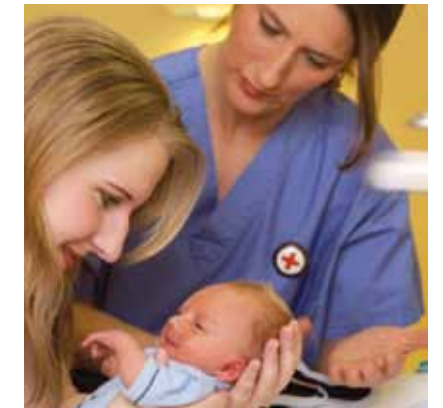
Daraus ergibt sich für unser Verständnis von Schwesternschaft

• dass in einem Auslandseinsatz der Rotkreuz- und Rothalbmondbewegung Neutralität eine Grundvoraussetzung darstellt.