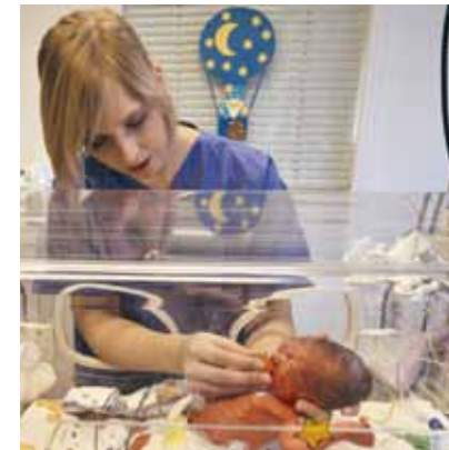
Für den Begriff Unabhängigkeit formulieren wir 1

Die Rotkreuz- und Rothalbmondbewegung ist unabhängig. Wenn auch die Nationalen Gesellschaften den Behörden bei ihrer humanitären Tätigkeit als Hilfsgesellschaften zur Seite stehen und den jeweiligen Landesgesetzen unterworfen sind, müssen sie dennoch eine Eigenständigkeit bewahren, die ihnen gestattet, jederzeit nach den Grundsätzen der Rotkreuz- und Rothalbmondbewegung zu handeln.