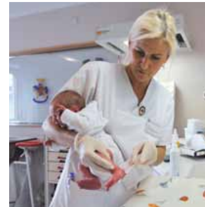
Für den Begriff Freiwilligkeit formulieren wir 1

Die Rotkreuz- und Rothalbmondbewegung verkörpert freiwillige und uneigennützige Hilfe ohne jedes Gewinnstreben.